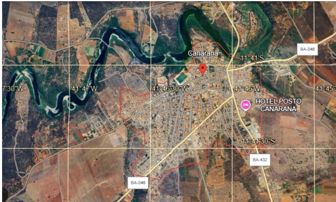
IMAGEM AÉREA POLIGONAL DA ZONA URBANA DO MUNICÍPIO DE CANARANA

GOOGLE LLC (EUA). Google Earth : Canarana - Bahia - Brasil. 2025. 1 imagem de satélite, color, 3D. Escala aproximada 1:4.487. Lat. 11°41'11"S; Long. 41°45'58"W. Disponível em: https://earth.google.com/web/search/Canarana,+BA/@-11.68643015,-1.76604709,701.10062856a,4487.82664621d,35y,359.99999999h,0t,0r/data=CnkaSxJFCiMweDc2OTE5Zjg4N2YxN2I2ZDoweGVhZTEzY2M0Y2QxMmEwNRnYR6eufF4nwCHlwpK8hOJEwCoMQ2FuYXJhbmEsIEJBGAIgASImCiQJ00-Chr1YJ8AR403xegZpj8AZEhV0ZpPdRMAhl37rqg7nRMBcAggBOgMKATBCAggASg0I_____ARAA . Acesso em: 2 jun. 2025.